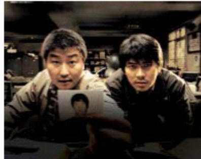
主演の2人（左がソン・ガンホ、右がキム・サンギョン）。『殺人の追憶』は全国上映中。公式ホームページは http://www.cqn.co.jp/mom/ 。この写真は(有)シネカノンより提供いただきました。

映画は1986年ソウル近郊の農村で若い女性の裸死体が発見されるシーンから始まる。彼女は無惨にも手足を拘束のうえ強姦されており、同じ手口の殺人事件が繰り返される。現地には特別捜査本部が設置され、地元の刑事バク・トゥマン（ソン・ガンホ）とソウル市警から派遣されたソ・テユン（キム・サンギョン）がこの難事件に挑む。バク刑事はたたき上げであり、拷問もいとわめ伝統的捜査を行ない、ソ・テユンは4年制大学を卒業した都会派であり、捜査資料を重視する近代的捜査を行なう。二人は当初対立しあうが、失敗を重ねながら互いを認め合うようになり、ついに有力容疑者ヒョンギュに行きつく。しかし、二人は証拠不十分でヒョンギュを拘束できず、決定的証拠である DNA 鑑定の結果を待つ間に、ソ刑事が捜査中知り合った女学生が殺される。ソ刑事は理性を失いヒョンギュを撃ち殺そうとするが、その時 DNA 鑑定の結果がバク刑事によって届けられる。しかし、その結果は予想に反したものであった。